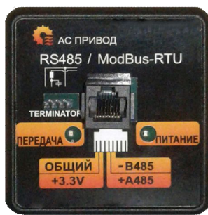
Рисунок 1. Вид панели, поддерживающей работу интерфейса RS485.

Подключение разрешено производить только при отключенном питании обоих устройств.